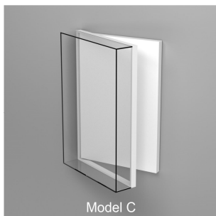
Model C Ganzglas Wandhaube Öffnungsmöglichkeit drehen vertically hinged opening system