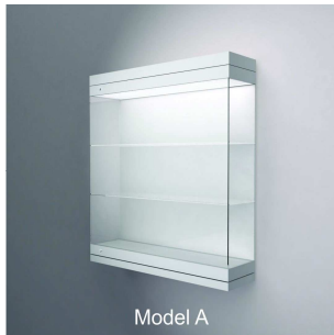
Model A Wandhängevitrine Wall Case